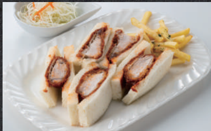
カツサンド 1,080円(税込)