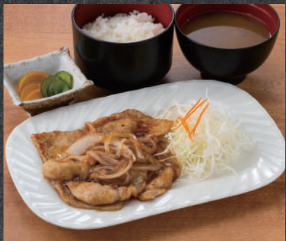
しょうが焼き定食