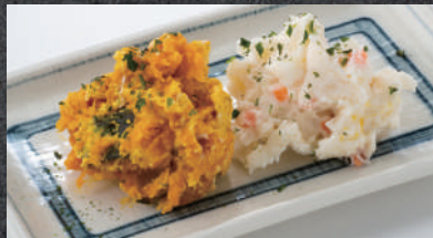
手作りポテトサラダ