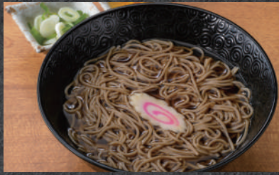
かけうどん・そば 温冷 700円(税込)