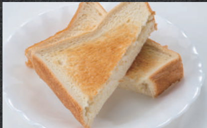
トースト(単品) 280円(税込)

※トースト単品以外はホットコーヒー、アイスコーヒー、オレンジジュースいずれか選べます