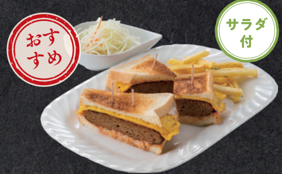
ハンバーグサンド 1,080円(税込)