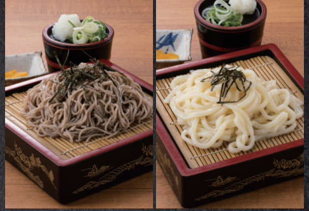
ざるうどん・そば 700円(税込)