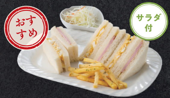
ミックスサンド(ハム、たまご) 810円(税込)