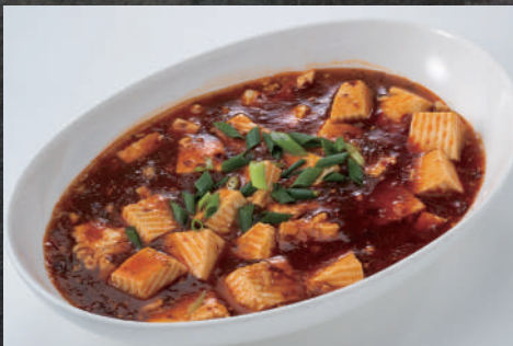
四川風麻婆豆腐 660円(税込)