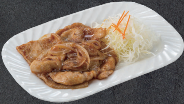
しょうが焼き 750円(税込)