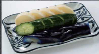
おしんこ盛り合わせ