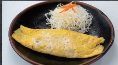
キムチ納豆オムレツ