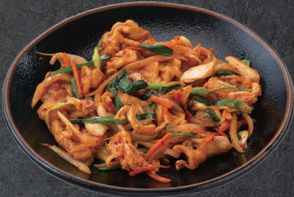
豚肉のキムチ炒め 690円(税込)