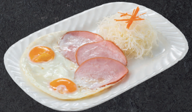
ハムエッグ 660円(税込)