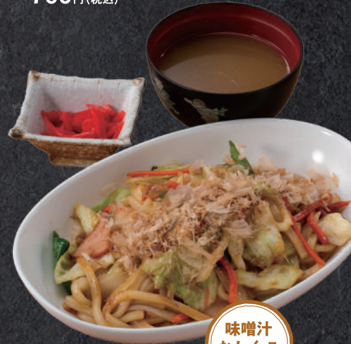
焼うどん 味噌汁 おしんこ 付 750円(税込)