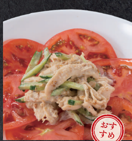
バンバンジーサラダ